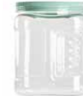
15248 1,5 L Ø 8,5 - 11,5 x 16,5 cm