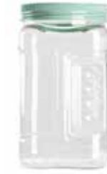
15249 2 L Ø 10,5 - 11,5 x 21 cm