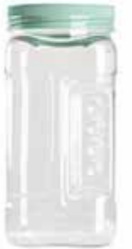
15250 2,8 L Ø 10,5 - 11,5 x 27,5 cm