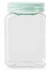
14535 1,2 L Ø 8,5 - 9,5 x 10,5 x 15,5 cm