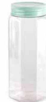
15341 1,5 L Ø 8,5 - 11,5 x 22 cm