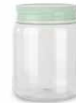
14307 1L Ø 8,5 - 11 x 14,3 cm