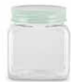
14310 800 ml Ø 8,5 - 9,5 x 10,5 x 11,8 cm