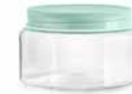
15339 500 ml Ø 8,5 - 11,5 x 9,5 cm