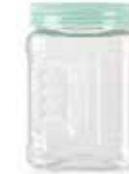
15247 1 L Ø 8,5 - 9,5 x 15,3 cm