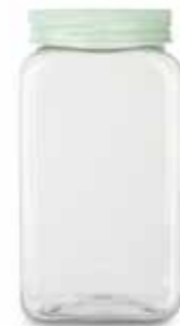
14311 1,6 L Ø 8,5 - 9,5 x 10,5 x 20 cm