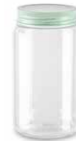
14308 1,5L Ø 8,5 - 11 x 20 cm