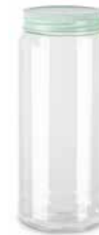
14309 2L Ø 8,5 - 11 x 25,5 cm