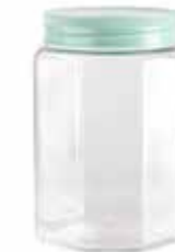
15340 1 L Ø 8,5 - 11,5 x 16 cm